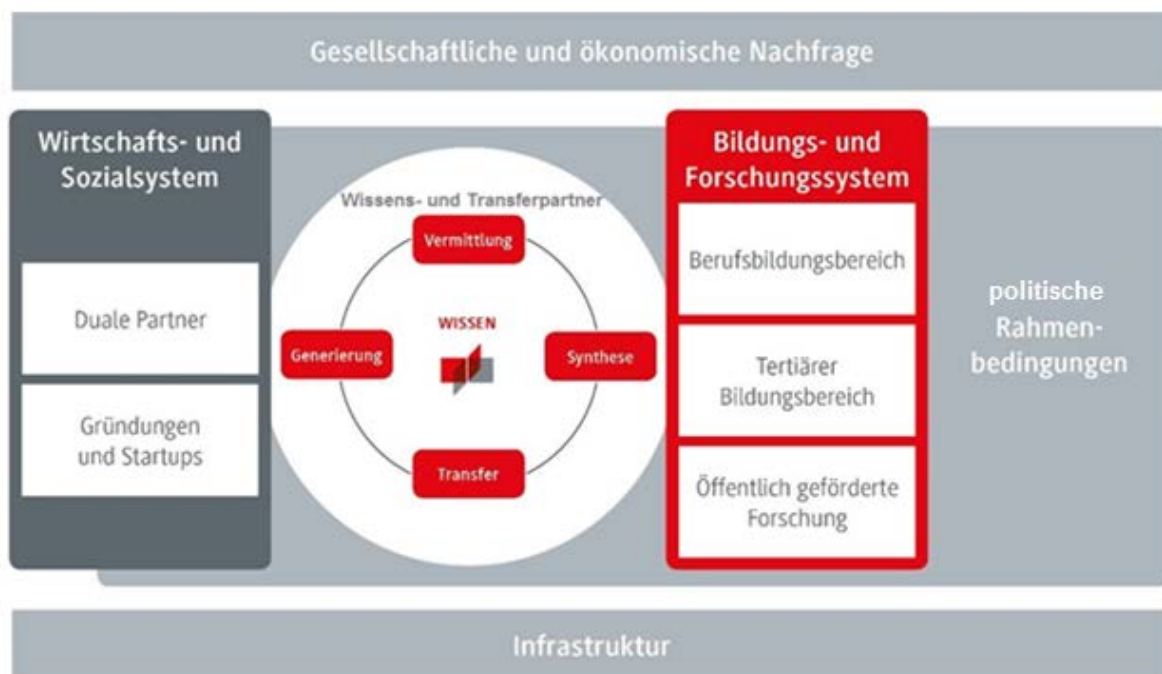
Abb. 2: Rolle der DHBW im regionalen Innovationsystem, angelehnt an Kuhlmann/Arnold (2001).

Die strukturelle Beschaffenheit der DHBW ist folglich die optimale Basis, einen großen wirtschaftlichen und gesellschaftlichen Mehrwert zu leisten, indem sie als regionaler Impulsgeber durch einen vielfältigen Wissens- und Technologietransfer und als Wissens- und Transferpartner agiert.